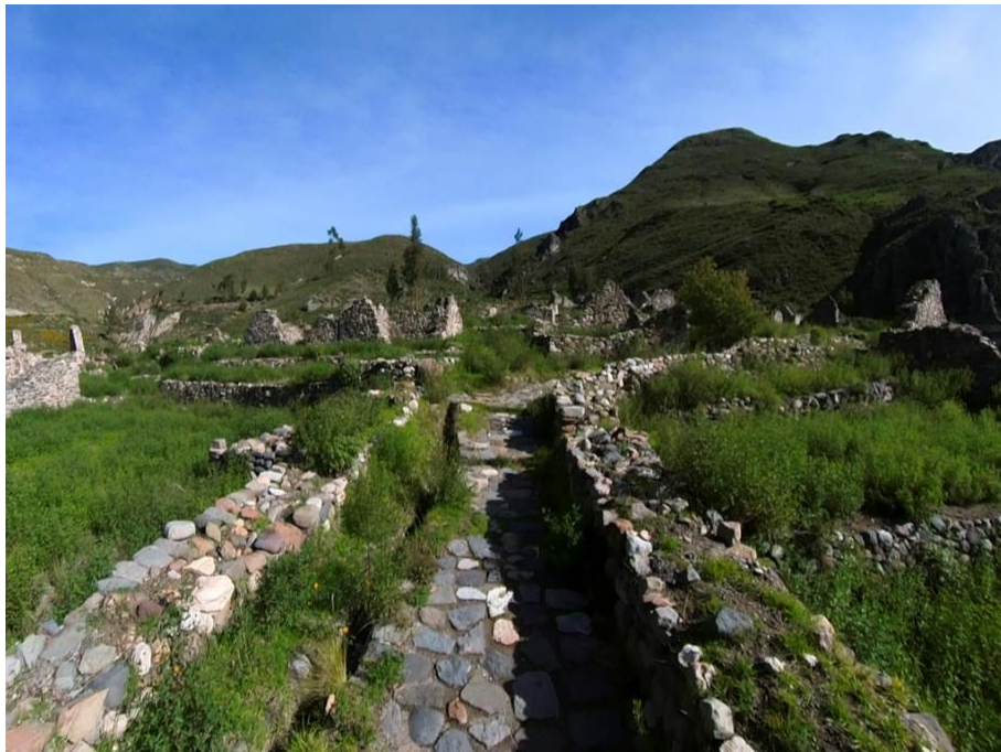
Complejo arqueológico de Uyo Uyo

Impulsamos la visita de zonas arqueológicas cerca al hotel, con el fin de promover la riqueza cultural de la zona y generar mayor atracción hacia esas zonas, entre ellas tenemos al conjunto arqueológico de Uyo Uyo, fortaleza de madrigal, complejo arqueológico de san Antonio, siempre fomentando el respeto por las áreas protegidas y la importancia de estas.